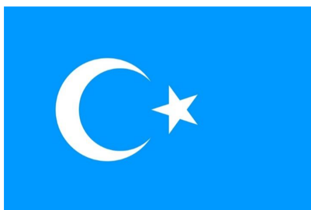
(ئاي - يۇلتۇزلۇق كۆك بايراق)

3. ماددا: دۆلەت بايرىقى — ئاي - يۇلتۇزلۇق كۆك بايراق.